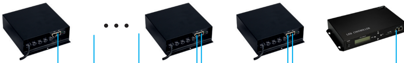
Рис 1. Все Slave-контроллеры подключаются к одному порту Master-контроллера.