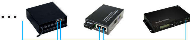
Рис 3. Использование оптоволоконного кабеля и медиаконвертеров для увеличения дистанции передачи сигнала.