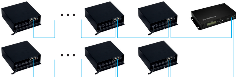
Рис 2. Slave-контроллеры подключаются к двум портам Master-контроллера.